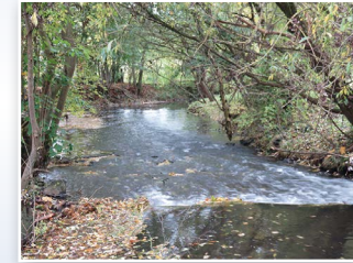
Wetter bei Trais